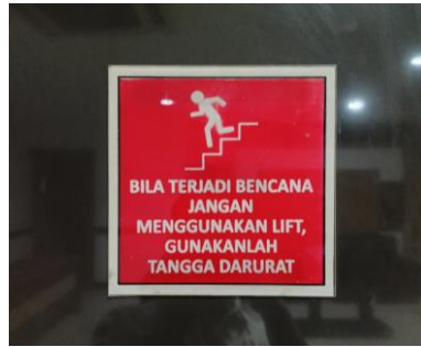
PERINGATAN TIDAK MENGGUNAKAN LIFT